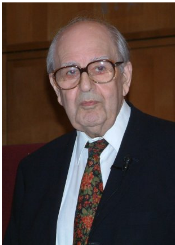
بارون درک عزرا (لرد عزرا)

بارون درک عزرا، ۸۳ پسر سیر دیوید عزرا، از شخصیت‌های مهم سیاسی و اقتصادی انگلیس و عضو مجلس لردهاست. او در سال ۱۹۱۹ به دنیا آمد، تحصیلاتش را در دانشگاه کمبریج به پایان برد و در سال‌های ۱۹۳۹-۱۹۴۷ در سرویس‌های نظامی و اطلاعاتی بریتانیا شاغل بود. درک عزرا در سال ۱۹۷۴ شوالیه و در سال ۱۹۸۳ بارون شد و به مجلس لردهای بریتانیا راه یافت. مجموعه کمپانی‌ها و مؤسساتی که لرد عزرا ریاست آن را به دست دارد یا از گردانندگان آن است فهرستی طولی را شامل می‌شود. این فهرست بیانگر حجم عظیم سرمایه‌گذاری‌های بنیاد عزرا است و پیوند آن با دو مجتمع پنهان روچیلد و مورگان و جایگاه برجسته آن در شبکه جهانی زرسالاری معاصر. ۸۴ خاندان‌های ساسون، کدوری، عزرا، گبای، و سایر خاندان‌های زرسالار یهودی بغدادی، از بنیانگذاران و رهبران صهیونیسم به‌شمار می‌روند. به‌نوشته سیر سیسیل راث، آرتور جیمز بالفور با تمامی اعضای خاندان ساسون دوست صمیمی بود و گاه برای اقامت در نزد آن‌ها به برایتون می‌رفت. او چند هفته پیش از مرگش نیز در برایتون میهمان ساسون‌ها بود. ۸۵