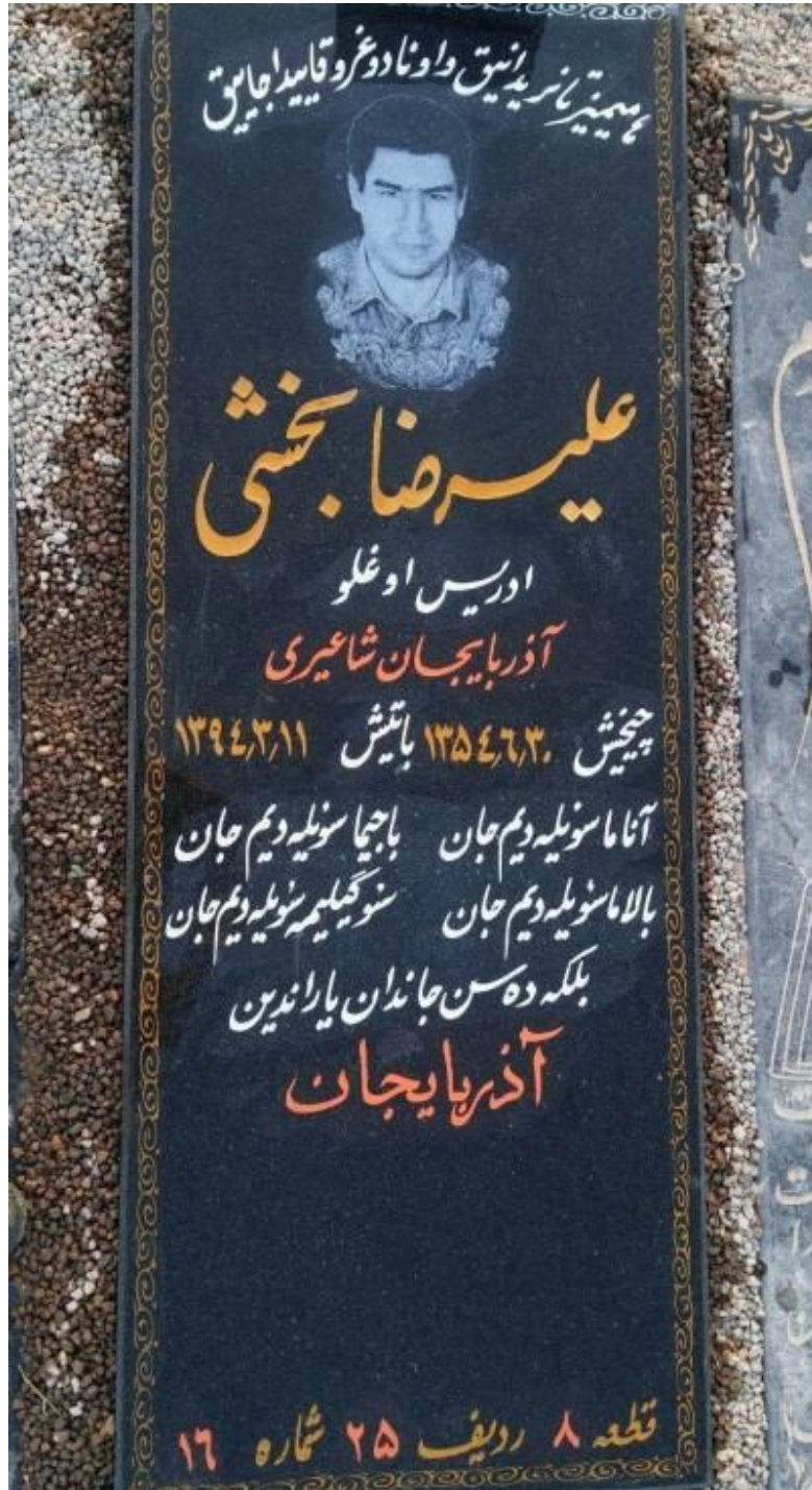
علیرضا بخشی نین قبیرداشی